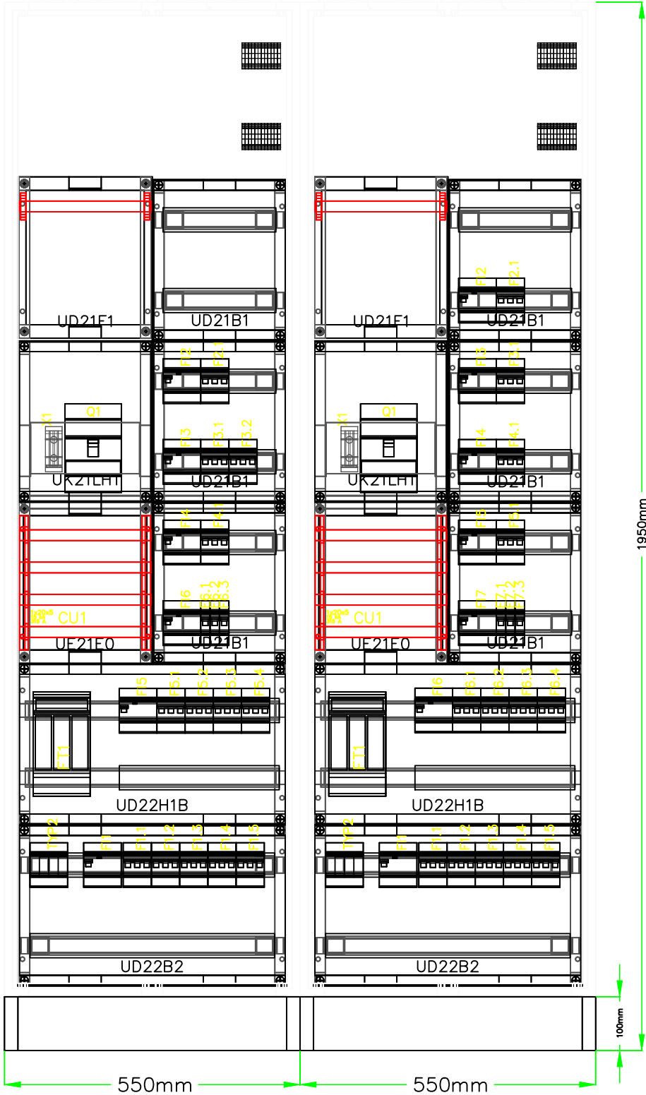
głębokość 275 mm